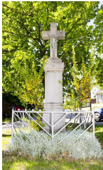
Kristus na kríži