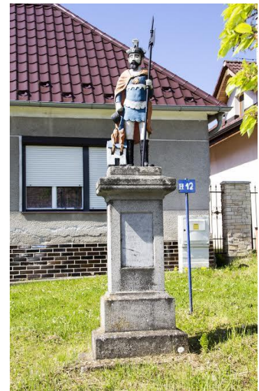
Socha svätého Floriána