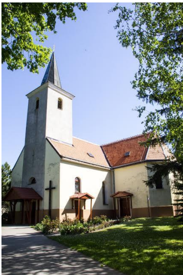
Rímskokatolícky kostol svätej Anny