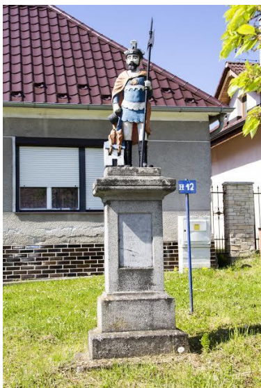
3. Socha svätého Floriána