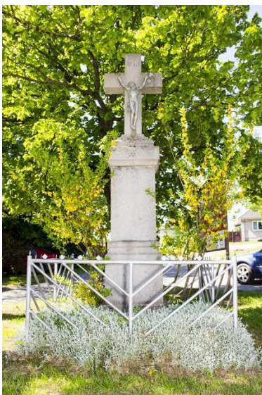
2. Kristus na kríži